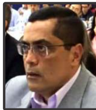
Israel Londoño Caresusto Secretario de Gobierno Departamental