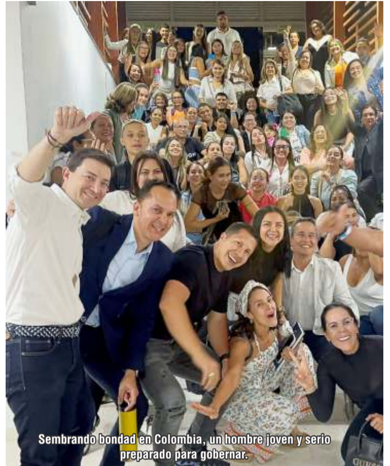
Sembrando bondad en Colombia, un hombre joven y serio preparado para gobernar.

Este fenómeno no es exclusivo de Colombia, pero su impacto aquí es particularmente grave debido a la polarización política en la que vivimos en los últimos años. Es necesario proteger el rigor académico y garantizar que las herramientas como Turnitin sean interpretadas por expertos. Entender que las coincidencias no son sín-