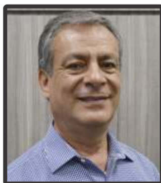
German Calle Presidente de la Cámara de Comercio de Pereira.