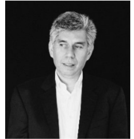
Por: Daniel Coronell