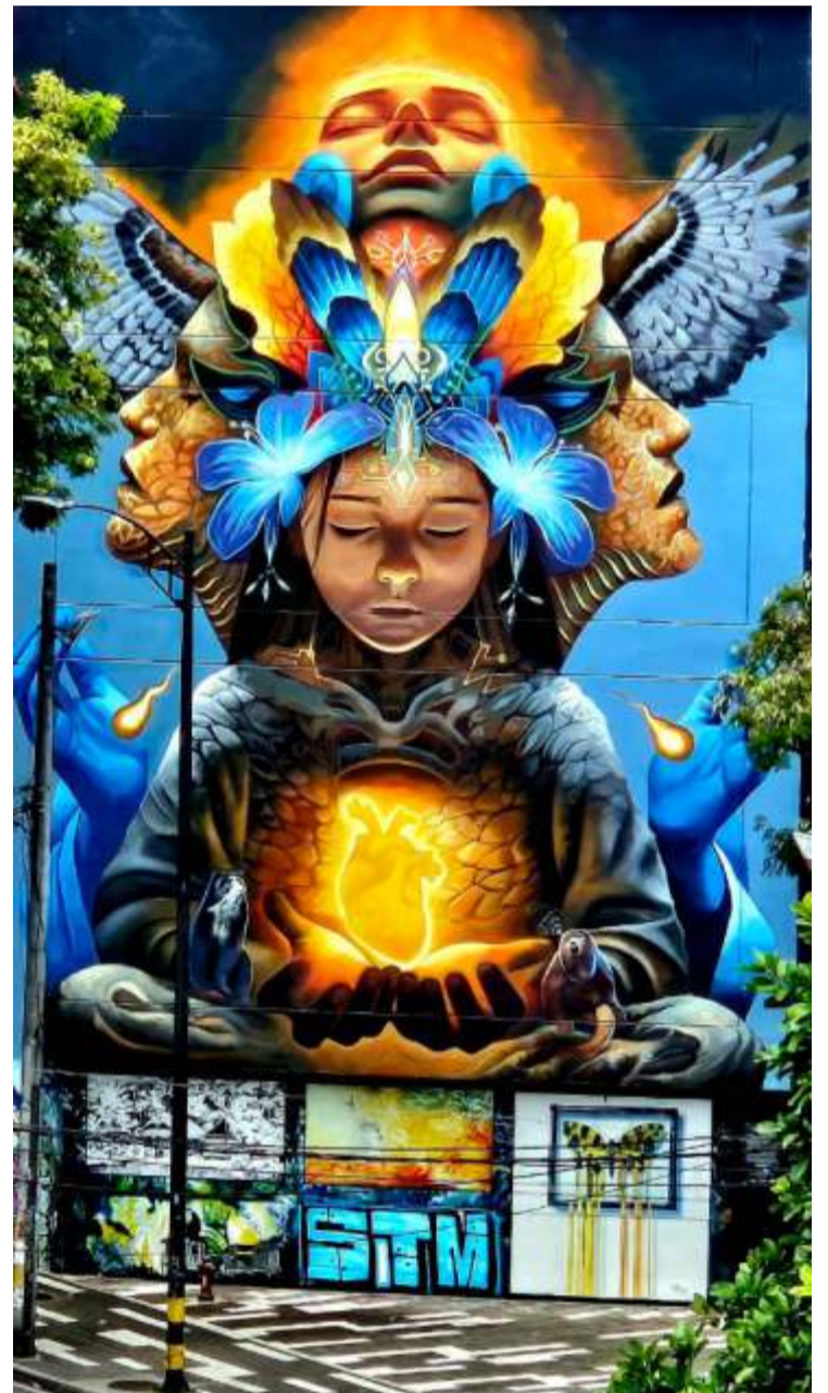
El mejor mural del mundo... Pereira lo tiene.

pesos. COTELCO, ala de la derecha extrema financia sus eventos a través del fondo de promoción turístico y del ministerio de industria y turismo que comanda el presidente Gustavo PETRO. Es decir, la ultraderecha derecha habla pestes del gobierno pero se usufructa con recursos del estado. En fin de cuentas, es con los impuestos que pagan los pereiranos que se dan la gran vida los oligarcas empresarios. Bienvenidos pero sin chismes.