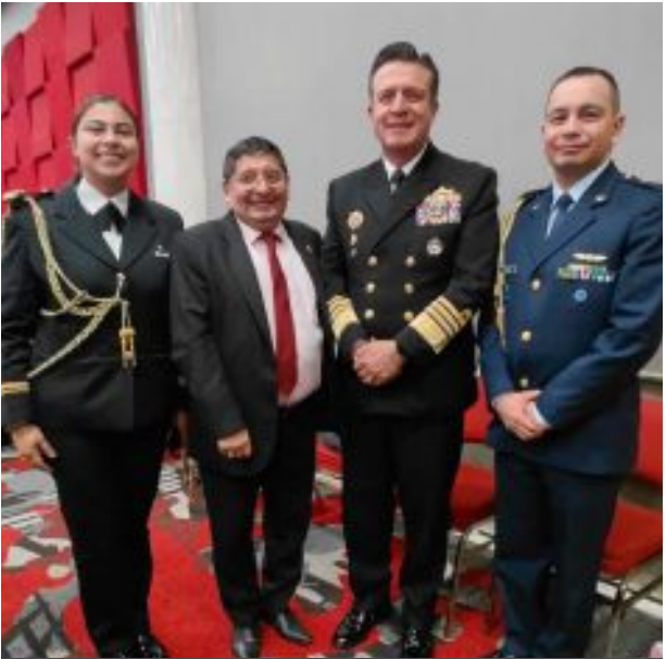
Gran momento por los combatientes de la patria. Gracias mi Almirante Francisco Cubides Comandante General de Nuestras Fuerzas Armadas.