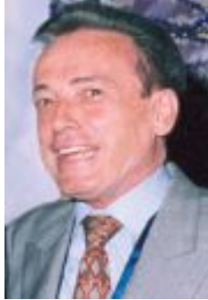
Manuel Neira Sánchez

El reingreso al cargo de Alcalde de Bogotá (victoria jurídica internacional ante la Corte Interamericana de Derechos Humanos-CIDM) creada en Bogotá en 1948)