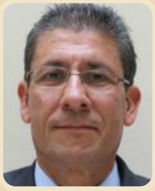
Juan Carlos Rivera Peña Lider indiscutible del partido conservador Risaralda Próximo congresista 2026/2030