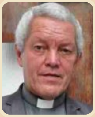
Padre Nelson Giraldo Alto prelado Iglesia Católica.