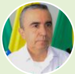
Jorge Diego Ramos Ex alcalde Dosquebradas Quiere ser congresista por partido de la U. en Risaralda