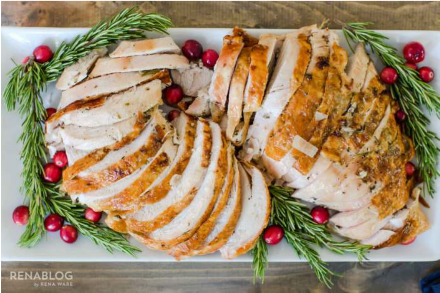
El pavo con todos sus aditamentos es la señal más sabrosa de que llegó la Navidad.