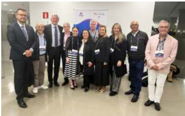
La presidenta de Anato Paula Cortés calle, se reunió con directivos de las agencias de viaje de Hispanoamérica en España y trajo las mejores expectativas para sus agremiados. La grafica es elu cuente y tare como anillo al dedo los nuevos parámetros para los viajeros en esta temporada decembrina