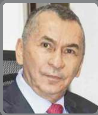
Diomedes Toro Ortiz de Belalcazar a Ex diputado