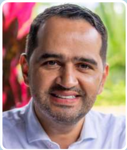
Giovanny Londoño Gonzalez Senado de la República Partido MIRA