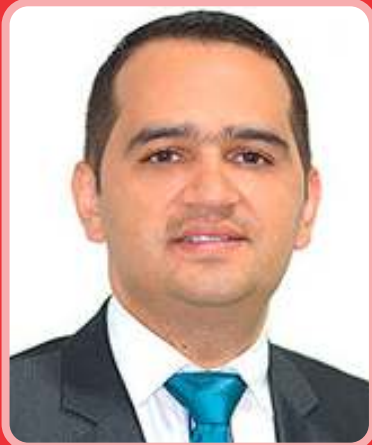
Giovanny Londoño Guevara Ex presidente Asamblea de Risaralda Quiere un escaño en el Senado