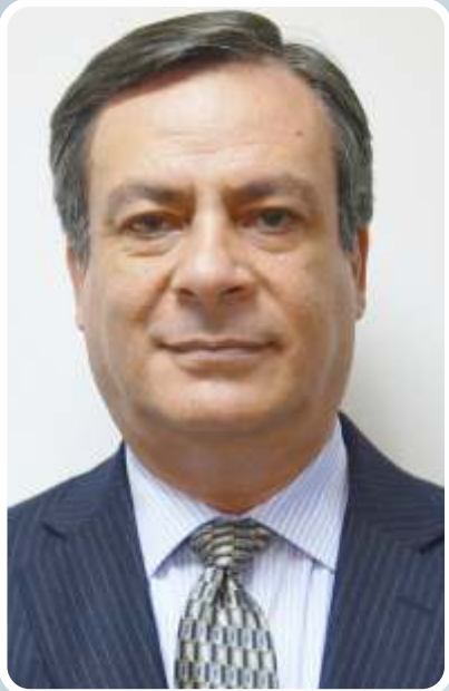
German Calle Presidente junta Cámara de Comercio de Pereira