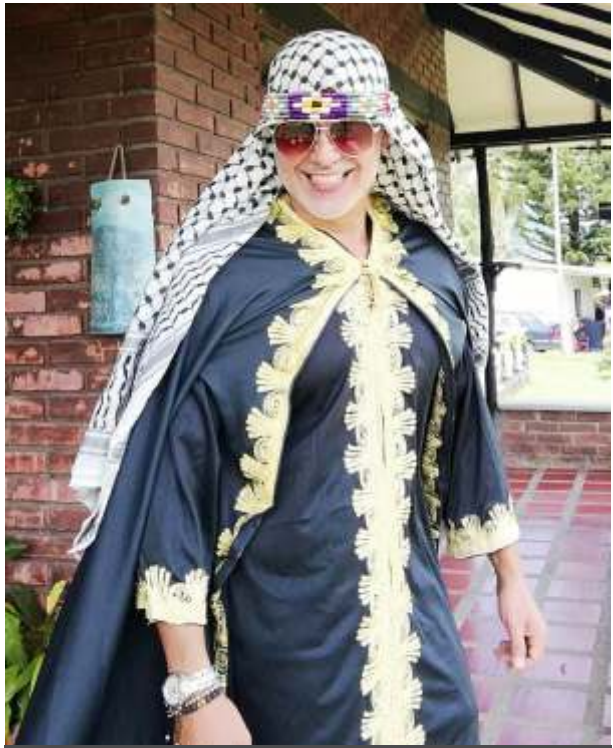
El actor de Netflix Javier Vargas será galardonado por diferentes organismos de la farándula local y nacional.