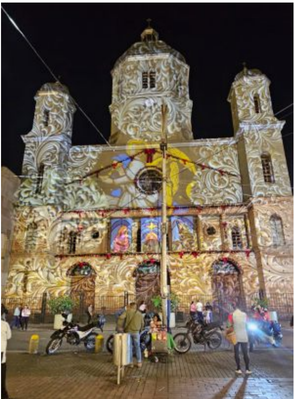
Catedral de Nuestra Señora de la Pobreza de Pereira

Reitero, sería de sumo interés que el VICEMINISTERIO DE TURISMO, dedique más partidas presupuestarias destinadas a la promoción turística selectiva de Colombia en el exterior dirigida a países emisores de turismo con un poder adquisitivo medio alto. Es la asignatura pendiente que tenemos en el país y que consiste en la ampliación y adecuación de infraestructuras para integrarnos como destino turístico de primer nivel