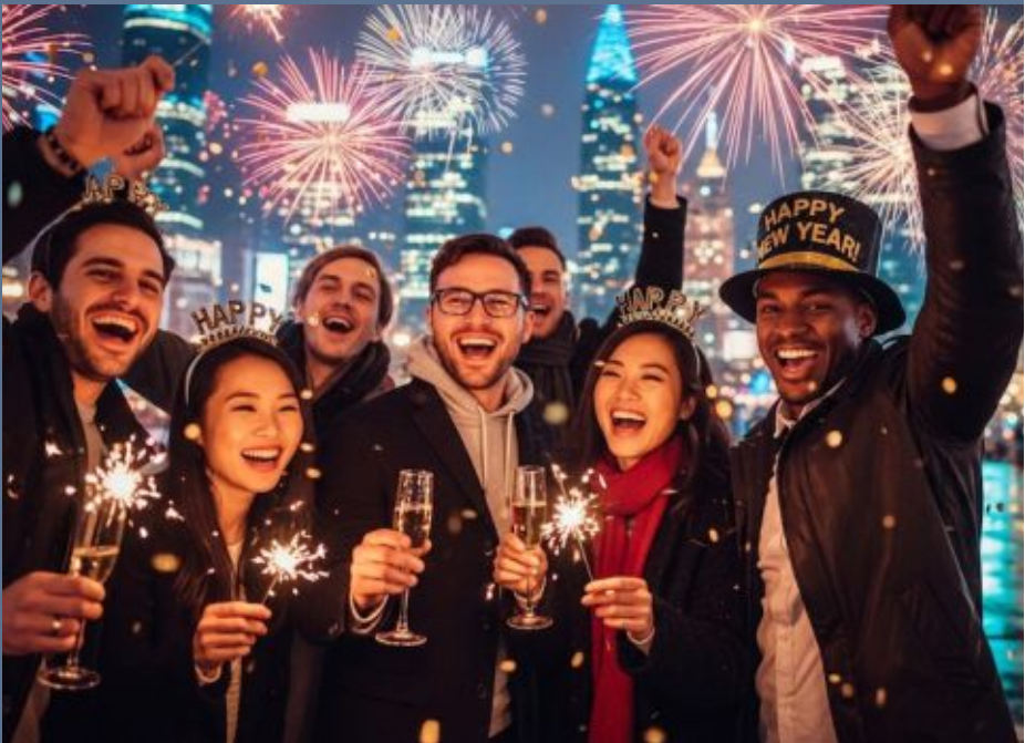
La ocupación hotelera en las principales ciudades supera el 80% durante la temporada de Año Nuevo, impulsada por eventos y espectáculos oficiales. (Imagen Ilustrativa Infobae)

El estudio resalta declaraciones como la siguiente: “La ciudad de