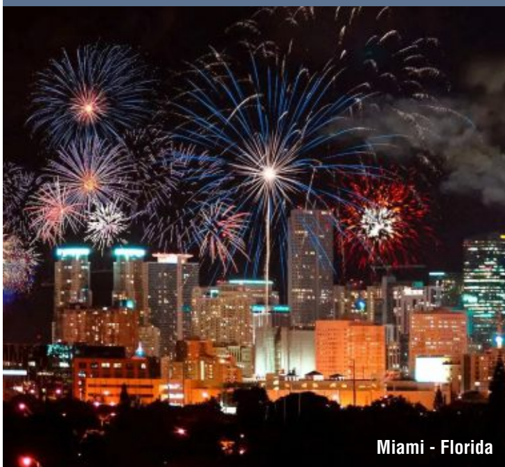
Miami - Florida