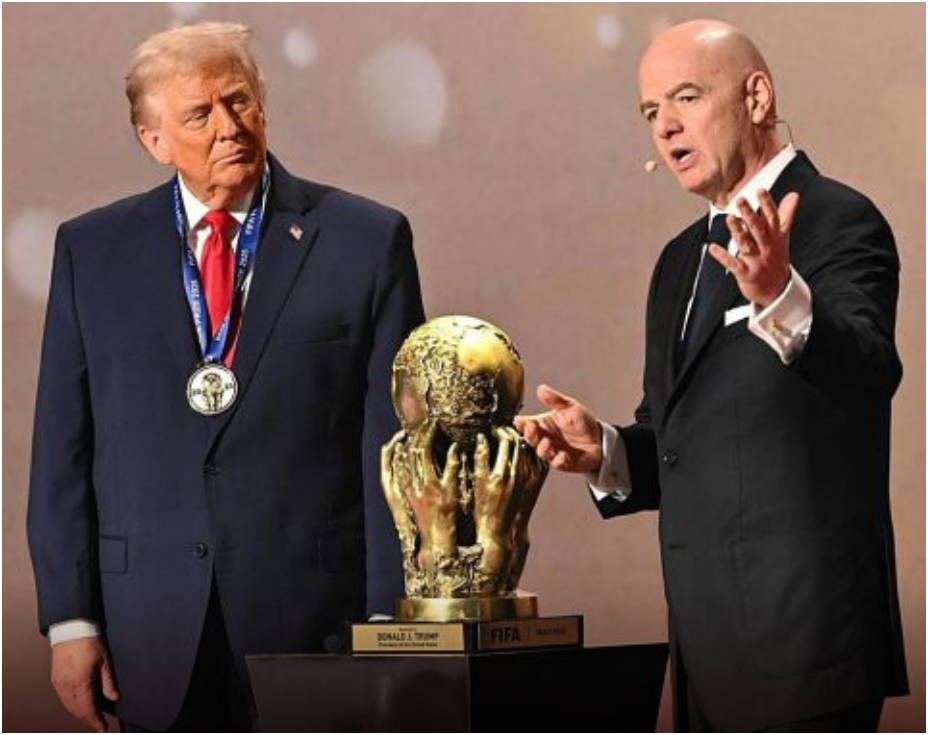
Gianni Infantino, presidente de la FIFA, y Donald Trump, presidente de Estados Unidos, uno de los países sede del Mundial 2026.

La única interrogante serán los seis cupos de repechajes (dos continentales y cuatro de la UEFA) que quedan por definirse en los próximos meses, pero que ya quedaron sorteados en los diferentes grupos. Por parte de la Conmebol, Bolivia tendrá que primero vencer a Surinam y luego a Irak si quiere avanzar al la Copa Mundial de la FIFA.