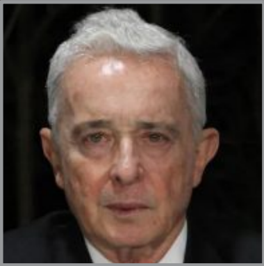
Alvaro Uribe Vélez