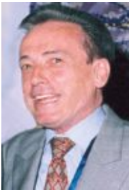
Por: Manuel Sánchez Neira

Compran voluntades, falsifican votaciones, adulteran resultados en connivencia con otros poderes de turno. Dichas maniobras las llevan a cabo con total impunidad y con el dinero de todos los ciudadanos, por lo que el engaño es redundante y el daño es mayor ya que éstos, en definitiva, conducen al deterioro de la democracia y aumentan la pobreza en sus respectivos países.