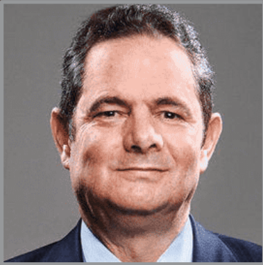
Germán Vargas Lleras