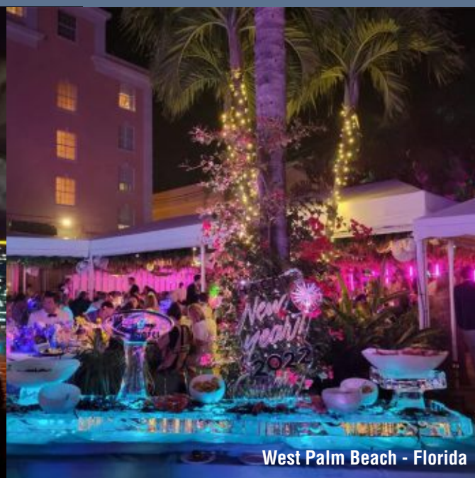
West Palm Beach - Florida

El ranking 2025 de WalletHub ubica a Orlando, Florida en el primer lugar como la ciudad con la mejor experiencia para celebrar Año Nuevo, seguida por Las Vegas, Nevada y Nueva York, Nueva York. Entre las razones del posicionamiento de Orlando destacan sus múltiples opciones para disfrutar de fuegos artificiales, abundancia de tiendas para fiestas, cantidad de bares y discotecas por habitante, y hospedaje asequible. El informe especifica que "Orlando ofrece una amplia variedad de espectáculos pirotécnicos, además de alternativas destinadas tanto a turistas como a residentes".