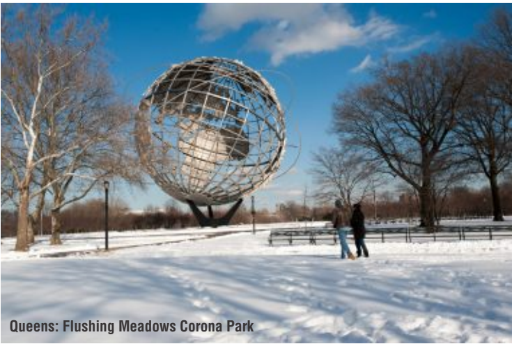
Queens: Flushing Meadows Corona Park

El parque más grande de Queens, Flushing Meadows Corona Park, combina áreas verdes, espacios recreativos,