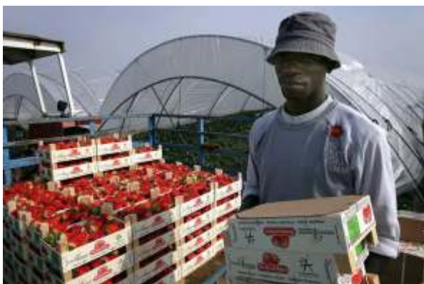
Muchos trabajadores extranjeros esperan ser contratados formalmente tras regularizarse.

Más de medio millón de los aproximadamente 850.000 inmigrantes que hoy se encuentran en situación irregular, de acuerdo a estimaciones, podrán normalizar su estatus migratorio.