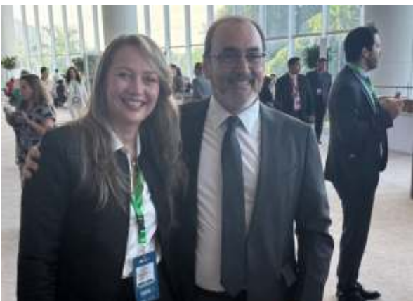
La presidente de ANATO, Paula Cortés calle con el presidente del banco interamericano, Sérgio Díaz Granados, en reciente reunión en Panamá, como antesala de la vitrina de los agentes de viajes.