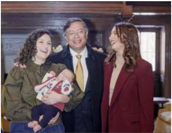
El presidente Gustavo Petro, se reunió con su hija en Whasgnston, antes de su cita con el presidente Trump en la casa Blanca. Su gira fue exitosa.