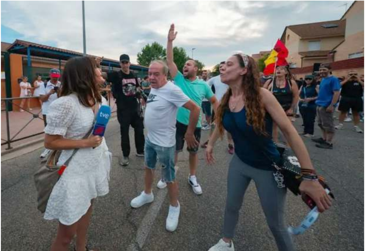
Los disturbios de Torre Pacheco fueron uno de los episodios de violencia xenófoba más graves registrados en España.

"Nosotras no somos partícipes de ese discurso. Creemos que es un discurso totalmente colonialista y racista. Nosotras no somos hermanas. El Reino de España no nos trata como hermanas, nos maltrata y sufrimos el mismo racismo institucional", sentencia.