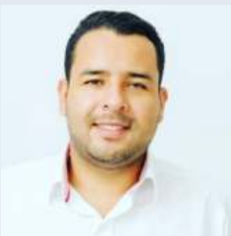
Joan Manuel Ríos Bedoya El Guerrero de los desposeídos