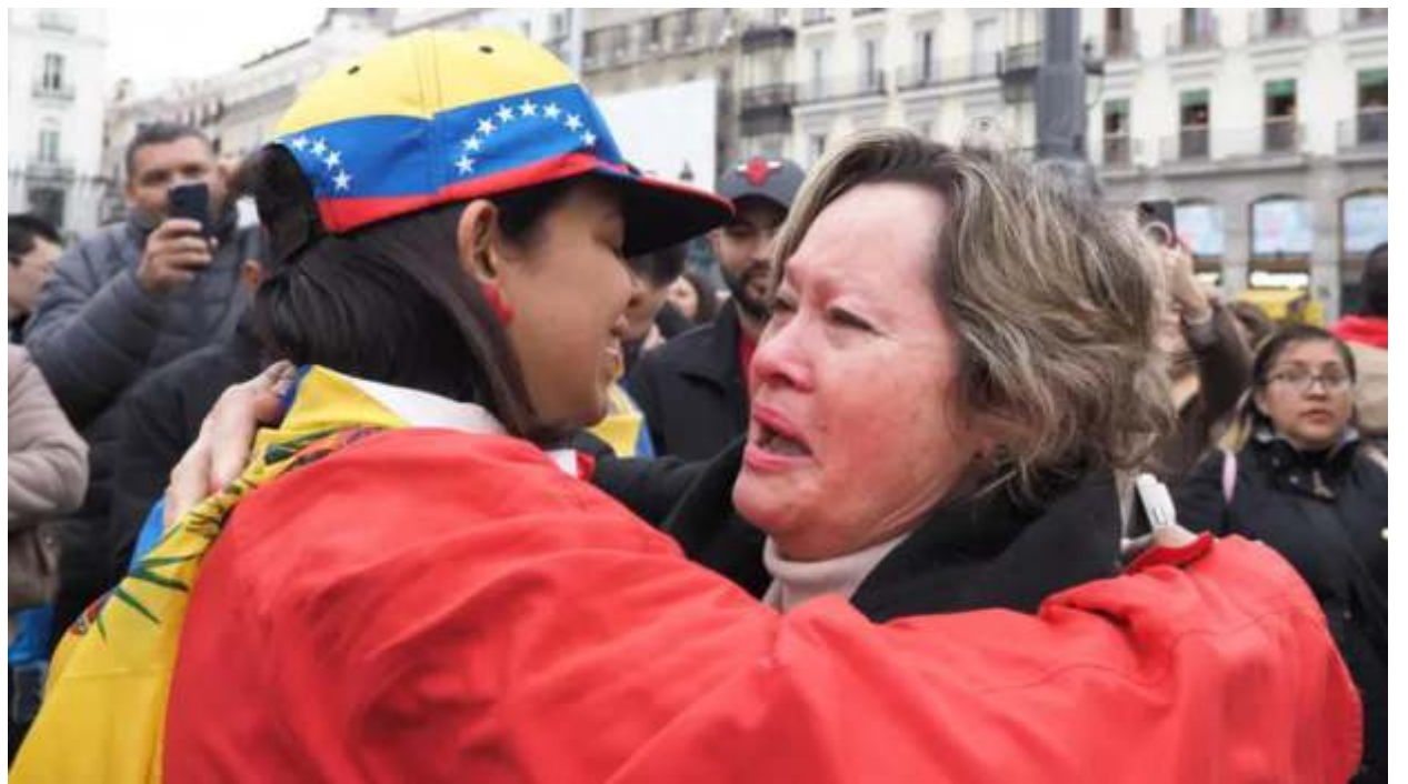
Los latinoamericanos son casi la mitad del total de inmigrantes en España.

La medida, refleja una política abiertamente favorable a la inmigración, contrasta con el endurecimiento generalizado de las políticas de la mayoría de los países desarrollados en este ámbito.