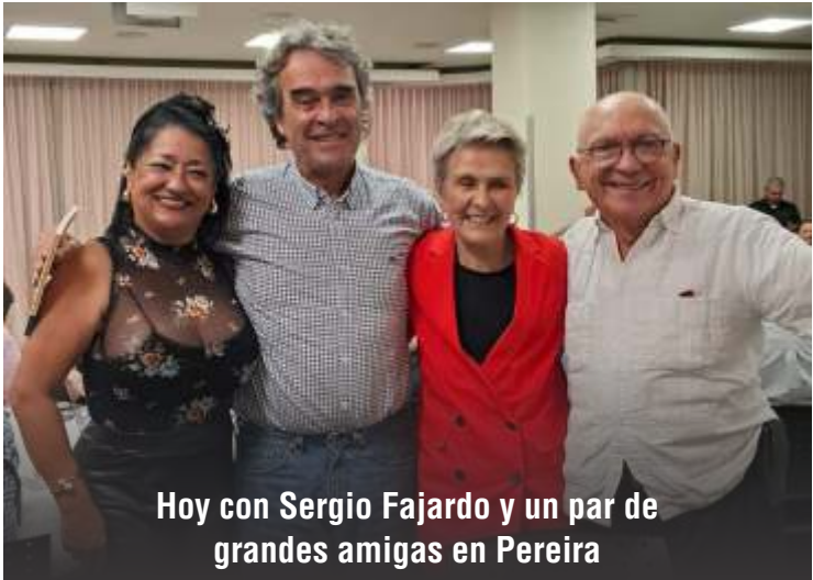
Hoy con Sergio Fajardo y un par de grandes amigas en Pereira