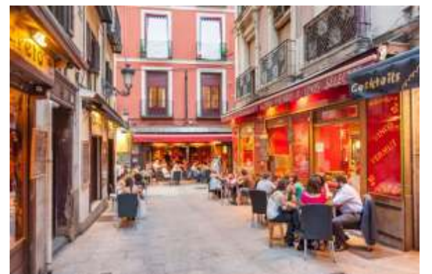
La hostelería en España -y en especial en grandes ciudades como Madrid o Barcelona- cuenta en gran parte con trabajadores extranjeros.

España recuperó recientemente el puesto 12 de las economías mundiales tras adelantar a México, Australia y Corea del Sur, con un PIB que ya supera los 2 billones, según datos del Fondo Monetario Internacional (FMI).