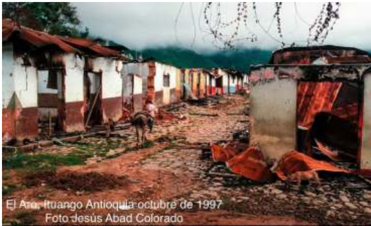
El Aro, Ituango Antioquia octubre de 1997

Otros procesos: Paralelamente, la Fiscalía presentó en enero de 2026 una demanda de casación ante la Corte Suprema de Justicia para intentar revertir la absolución previa de Uribe en su caso por soborno a testigos y fraude procesal.