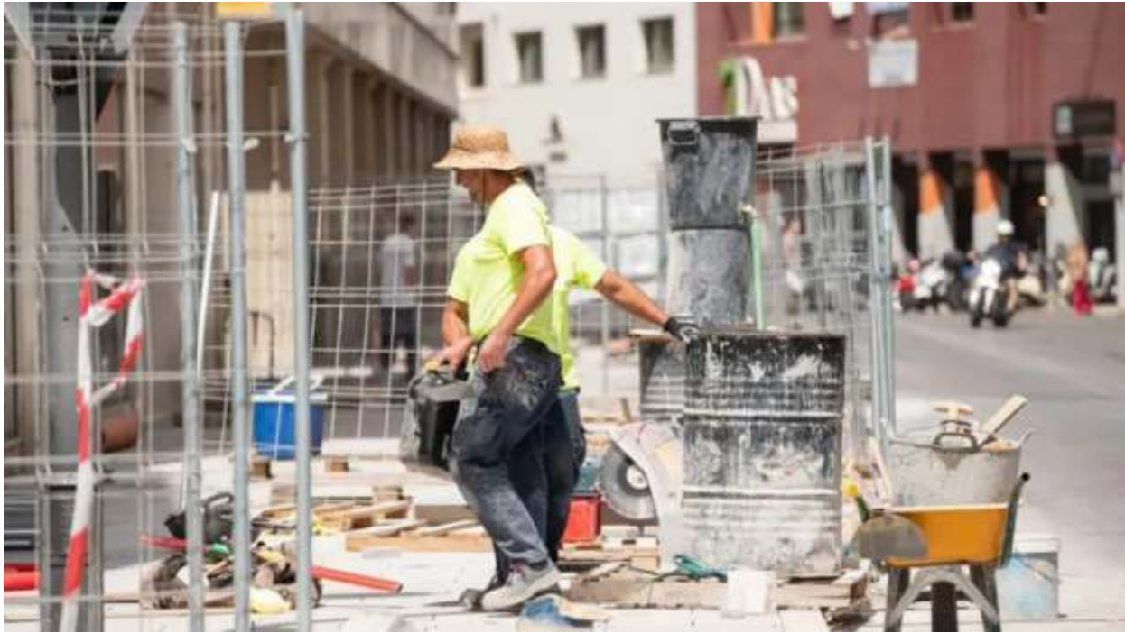
El mercado laboral español está en un buen momento.

España cerró 2025 con 605.400 nuevos empleos y alcanzó la cifra récord de 22,46 millones de trabajadores y 118.400 parados menos.