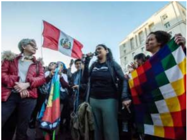
Los inmigrantes latinoamericanos contribuyen de manera decisiva a la economía española, además de integrarse con mayor facilidad en los barrios y comunidades.

El académico señala que la política de puertas abiertas a la inmigración, y el consiguiente rápido incremento poblacional, también agrava lo que muchas encuestas señalan como la principal preocupación de los españoles: la falta de acceso a la vivienda.