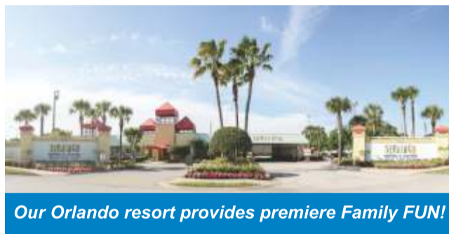
Our Orlando resort provides premiere Family FUN!