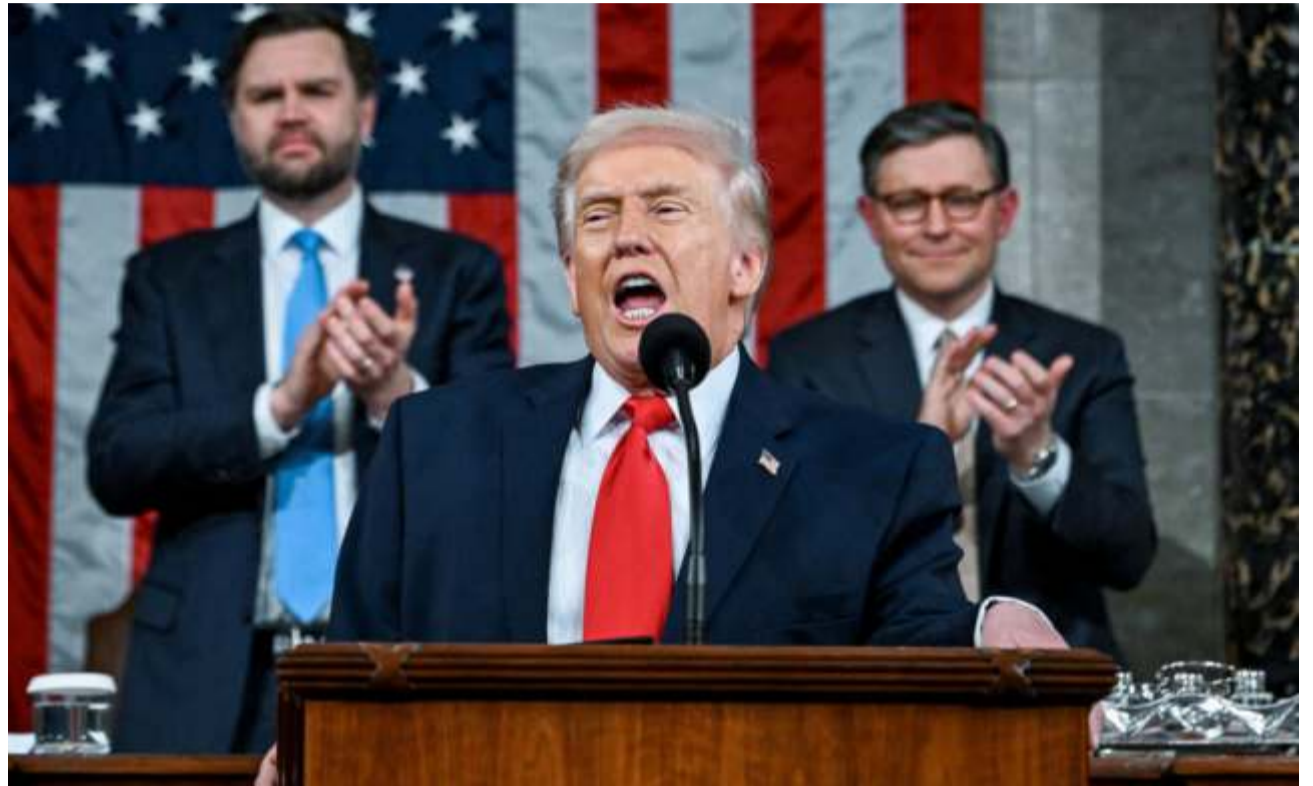
Donald Trump, presidente de Estados Unidos.

El presidente estadounidense, Donald Trump, dijo a periodistas que Estados Unidos ha estado conversando con el gobierno cubano y que considera tomar este país de forma "amistosa".