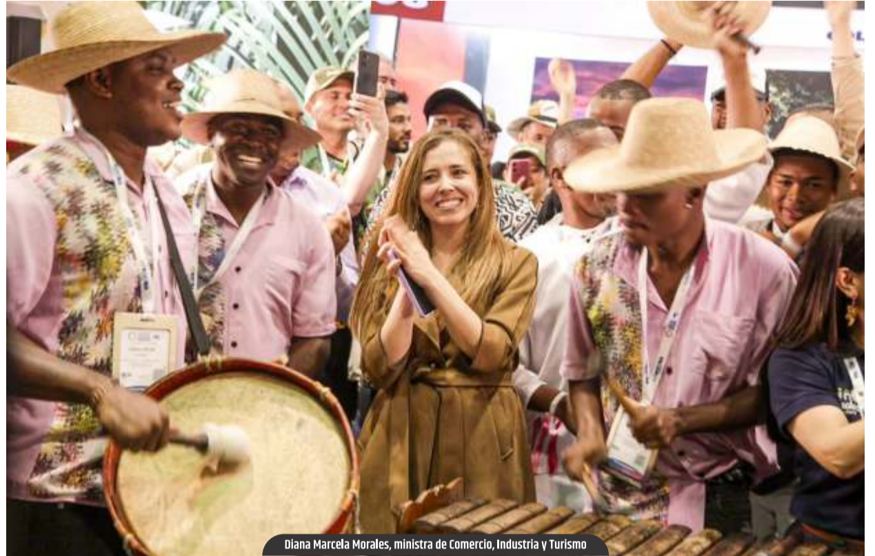
Diana Marcela Morales, ministra de Comercio, Industria y Turismo

En entrevista con Caracol Radio, la ministra de Comercio, Industria y Turismo, @dmmorales, destacó las cifras que evidencian cómo el turismo se consolida como motor de transformación productiva del país. Colombia cerró 2025 con 22 millones de visitantes no residentes, el registro más alto de su historia, y 14,8 millones de visitantes extranjeros, lo que representa un crecimiento del 138 % frente al gobierno anterior.