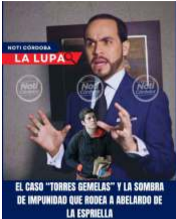
El tigre no es como lo pintan

Un candidato puede llamarse tigre si quiere. Lo que importa es: Ruge con datos verificables? Sus cifras resisten auditoría? Su discurso coincide con los hechos? Cuando alguien proclama 5.500.000 firmas y Luego 3.800.000 resultan inválidas, el problema no es zoológico. Es matemático, ético y de fiscalía.