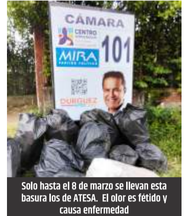
Solo hasta el 8 de marzo se llevan esta basura los de ATESA. El olor es fétido y causa enfermedad

Nadie puede decir que mañana va a temblar. Nadie puede predecir jamás. El hospital San Jorge tiene listo el pabellon de los "quemados" son tres pisos. Tienen lista la pomada, las cremas y el