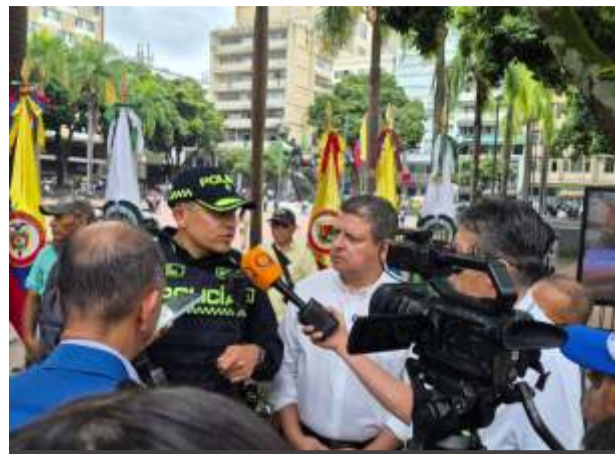
Y llegó el Nuevo comandante de la policía metropolitana de Pereira. Fue recibido por el secretario de gobierno de la capital de Risaralda. Orfandad de poder en el acto del coronel Óscar Leon Ochoa Sánchez. El gobernador estaba de paseo por Europa con 5 mil euros diarios de viáticos por cuenta del erario.