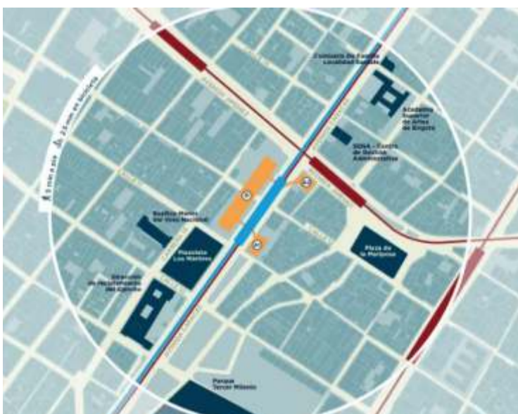
La estación 12 del metro estará ubicada en la av. Caracas con av. Jiménez.