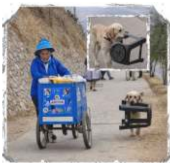
UN PERRO TOMÓ LA INICIATIVA DE AYUDAR A SU DUEÑO A CARGAR UNA SILLA