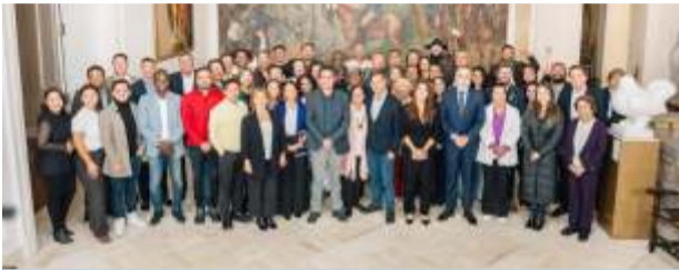
El triunfo del pacto histórico. Una gráfica para el recuerdo. Triunfo total del partido de nuestro presidente el pasado 8 de marzo. Elocuente la imagen.