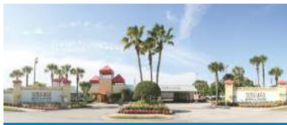
Our Orlando resort provides premiere Family FUN!