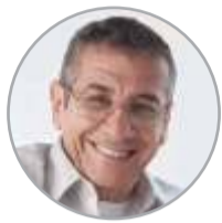
Por: Luis Angel Velasquez Especial para Primera Plana

Según informe de la doble W el ex parlamentario tuvo vínculos con el narcotráfico en un informe especial que saldrá en otra edición.