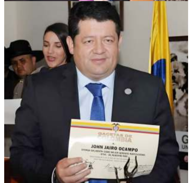
Dos periodistas para recordar siempre. Fueron galardonados con Galardones Heterogéneos de Gacetas de Colombia. La justicia divina existe. Sobran las palabras