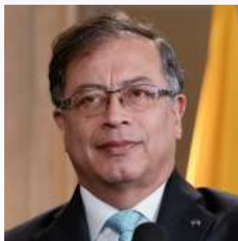
Gustavo Petro Urrego Próximo secretario de la ONU