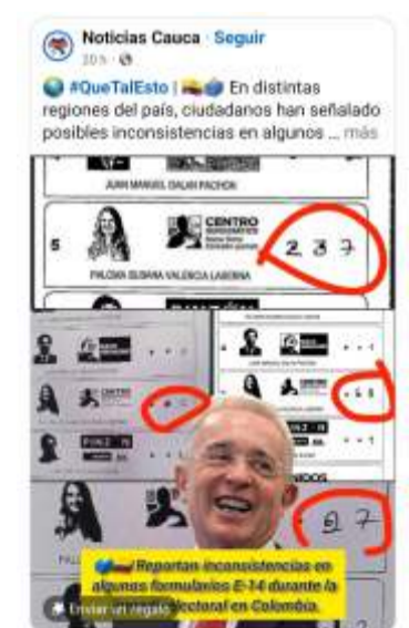
En varias regiones del país también hubo fraude electoral. Aumentando los números al formulario E14 a favor de Paloma Valencia. del urubismo.