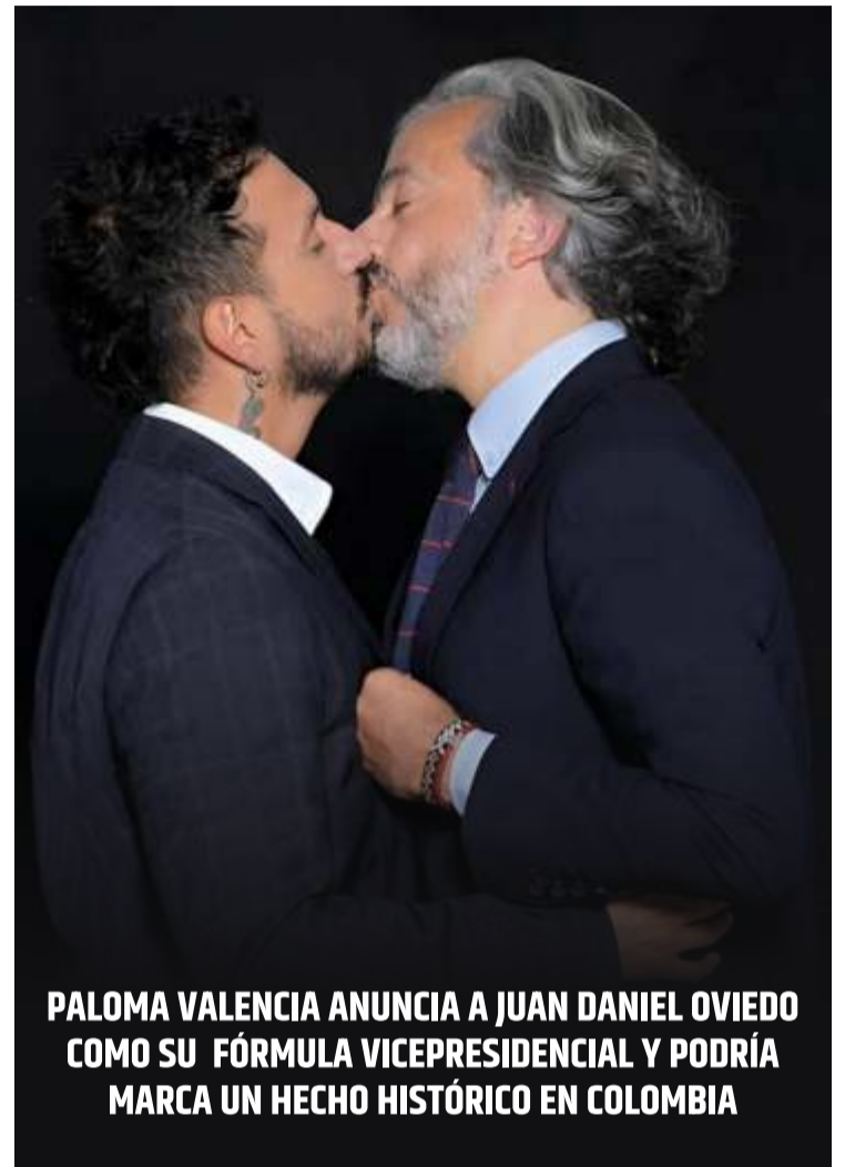
PALOMA VALENCIA ANUNCIA A JUAN DANIEL OVIEDO COMO SU FÓRMULA VICEPRESIDENCIAL Y PODRÍA MARCA UN HECHO HISTÓRICO EN COLOMBIA