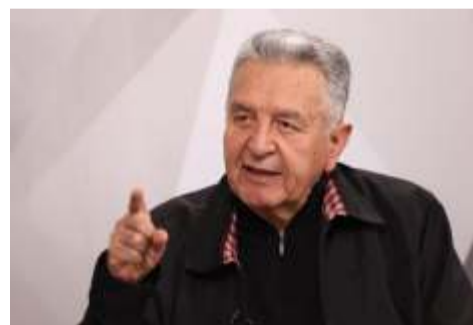
El exalcalde de Bogotá Lucho Garzón