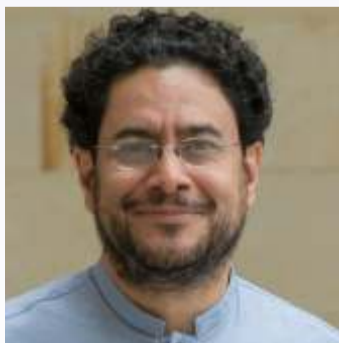
Iván Cepeda Próximo presidente de Colombia