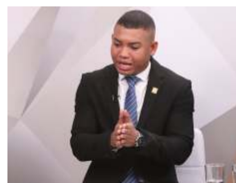
Angélica Lozano, senadora

Horacio José Serpa, hijo del excandidato presidencial Horacio Serpa, no llegará al Senado. Y a Miguel Polo Polo, el polémico representante, no le valió el respaldo político que obtuvo del candidato presidencial Abelardo de la Espriella.