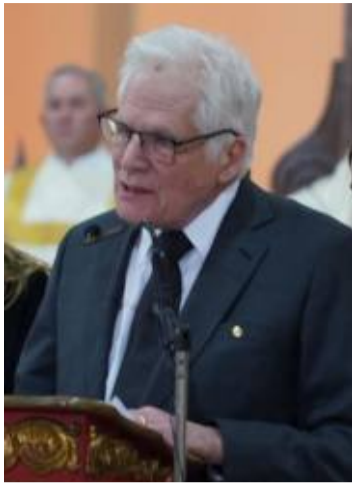
En el entierro del CD

Tristeza y decepción ver al papá de Miguel Uribe Turbay decir en su discurso de despedida a su hijo que, se lo entrega al condenado Álvaro Uribe.