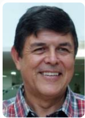
Jairo Arango Gaviria Ex alcalde de Pereira