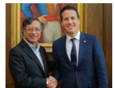
En la imagen: El presidente Gustavo Petro y parte de su gabinete se reunieron con el senador Bernie Moreno y delegados de Estados Unidos

El pasado viernes, una delegación de EE. UU. sostuvo una reunión con el presidente Gustavo Petro. Moreno, específicamente, tiene previsto un encuentro con congresistas del Centro Democrático.