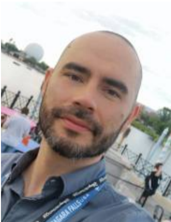
Malasia en Colombia

Y al centro democrático para que gane las lecciones presidenciales del 2026, tremendas propagandas para RCN, caracol, semana y demás medios de la derecha extrema van a utilizar la muerte del nieto de Turbay Ayala para hacer campaña con el odio y sus filosofías incendiarias. Paz en la tumba del protegido del genocida y del movimiento político de la ultraderecha.