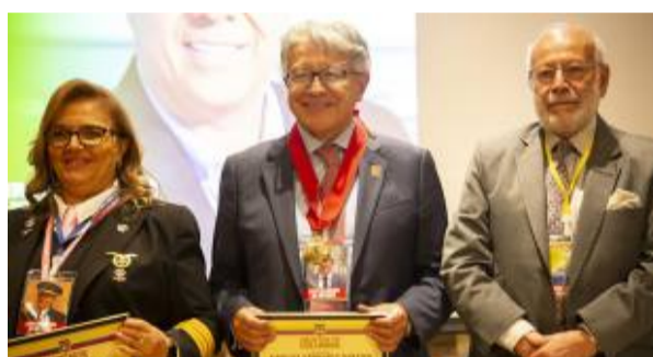
Galardonados con las facetas heterogéneas en la Gran Colombia.